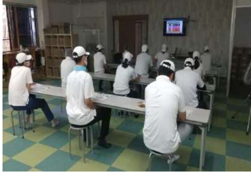
※食中毒や防災についてYouTubeで勉強中。

では、政治とは？『しーん』となりますよね、難しいですよね、ただ施設のルールと工賃の分け方を理解している皆さんは、『国民全員に10万円の給付金を払うことを決める事です』と聞いてピン！と来たようです。ほかに、各党のマニフェストを分かりやすい言葉に置き換え説明、今回の選挙は15人中11人が投票に行きました！