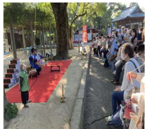
⑨日本伝統芸能 猿まわし 大盛況

とても利口なお猿さん、お兄さんとの信頼関係が伺える舞台でした。 一日の疲れも吹っ飛ばす楽しい時間でした♡