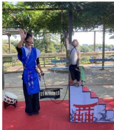
⑧日本伝統芸能 猿まわし

一日に3度しか行われていない公演 お若い男性の上品な言葉遣いと態度にあっばれ、日本伝統芸能を感じました。