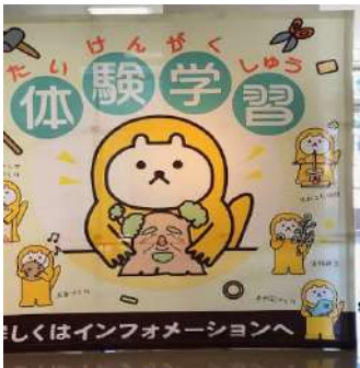
④むなかた館の体験学習

◎お次は、世界遺産ガイダンス施設【海の道むなかた館】3Dシアターで見る沖ノ島の神秘的な世界を音と映像でリアルな体験を致しました。