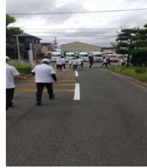
※避難場所の東コミュニティへGO！