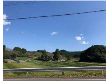
⑥むなかた館前の風景