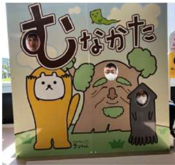
⑤海の道むなかた館のリアルな体験