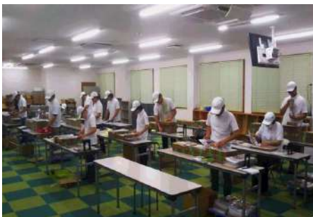
作業場では一人一人真剣です。

ゲームしたり歌ったり大笑いしたりしてすごく楽しいですよ、働く事や楽しいことが好きな方、大歓迎です！