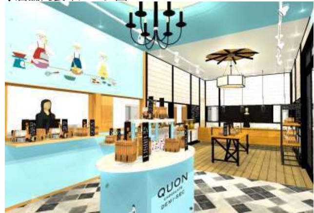
↓店舗内装イメージ図