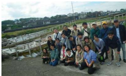
お腹いっぱい！（鮎やなばの前に全員集合）

大山ダムから道の駅、そしてお昼のアユ料理と行く先々で 皆さん食べる食べる、アユの前にアユ、アイスクリームやケーキと 食べ回りそして昼食も皆さん見事に完食！ 豆田町の工場見学、散策でもラムネに鶏の唐揚げに饅頭と脱帽です！ 帰りのバスは皆さん熟睡、そりゃそうですね (-_-)zzz