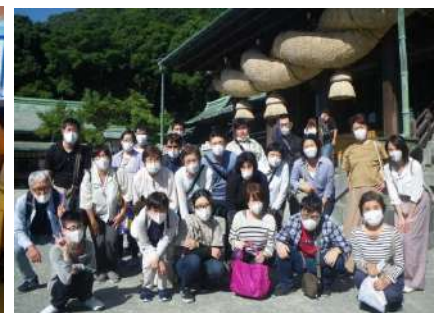
みんな大好きバスハイクの様子