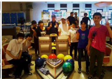
お楽しみ会のボーリングの1コマ