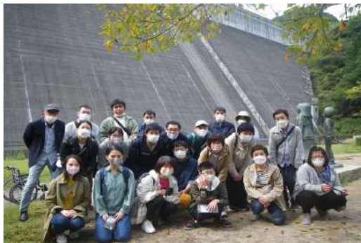
進撃の巨人の銅像がある大山ダムにて

今年の夏は、新型コロナが5類に移行したことで 本来閑散期の8月～9月が大忙しでした。