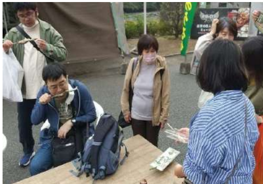
昼食（アユ料理）の前に道の駅でもアユを・・・

それならば、猛暑を避けて10月に夏の慰労会は決定。 今回も、訓練生の皆さんや職員から色々な場所の提案が 行われ、プレゼンテーションを経て、大分県日田市に決定しました。 なんと、プレゼンターは理事長でしたが、当日は急病にて欠席(+_+) 一番楽しみにしていたのですが・・・でも、皆とても楽しめました。