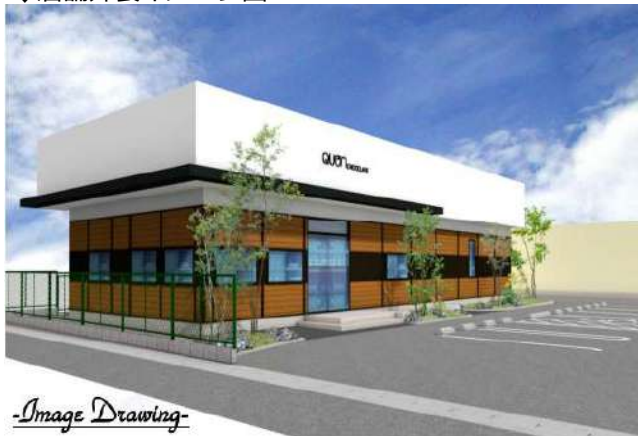
↓店舗外装イメージ図

男だから女だからとか、障がいがあるとか無いとか、働ける時間が短いとか長いとか、高齢だから若いから だとか、性的マイノリティだとか、貧しいからだとか裕福だからとか、学歴があるか無いからだとか “理由を付けるのをやめてみんなが働ける場を作りたい”という考え方に共鳴共感をし、フランチャイズ加盟を する運びとなり、二年間かけてやっとオープンにこぎ着けました、是非皆さん応援を宜しくお願いいたします。