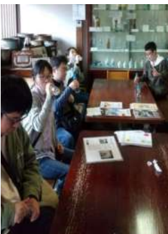
七色ラムネうまいね！ 豆田の町の散策といっても食べてばかりでした。